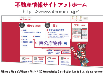
Where's Waldo?/Where's Wally?