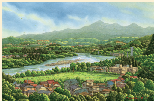
松本忠 画「信濃川遠望」(新潟県小千谷市)