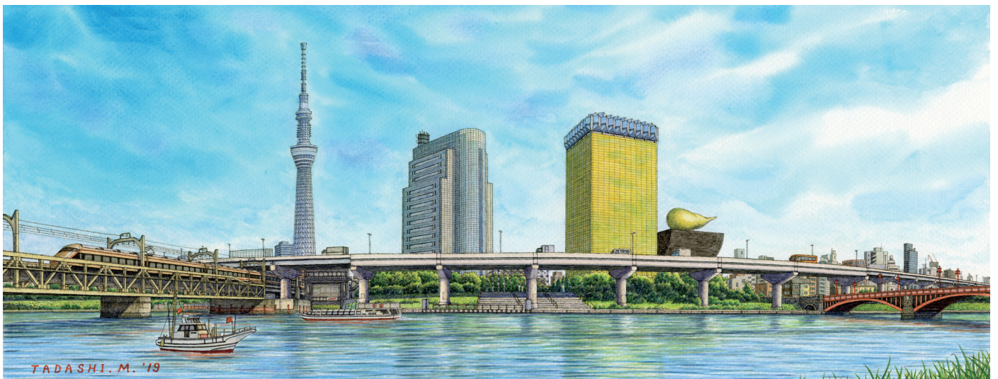
松本忠 画「水辺のパノラマ」(東京都墨田区)