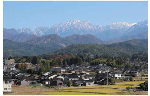
剣岳(町中からの景色)

登山やトレッキングを楽しめる山々、科学的に癒し効果が認められた「森林セラピー基地・剣・きらめきの森」など、自然環境に囲まれた暮らしが心を豊かにします。澄んだ空気に立山連峰の雪がもたらす清らかでおいしい水、それによって育てられた栄養豊富な野菜や肉、魚などが生活の質を良くしてくれます。