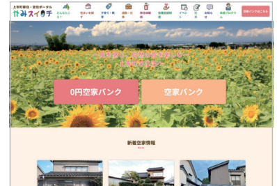
上市町 空家バンクサイト 「かみスイッチ」

取得希望者に対しては、自治体職員も立会のもと内覧会を行い、取得者の決定後は所有者と取得者間にて所有権移転登記等の手続きを進めていただきます。この取組みを始めてからこれまでに28件の空き家が登録され、26件が成約に至っています。