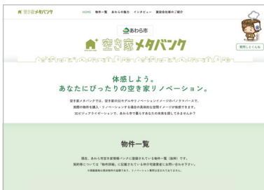
あわら市 「空き家メタバンク」