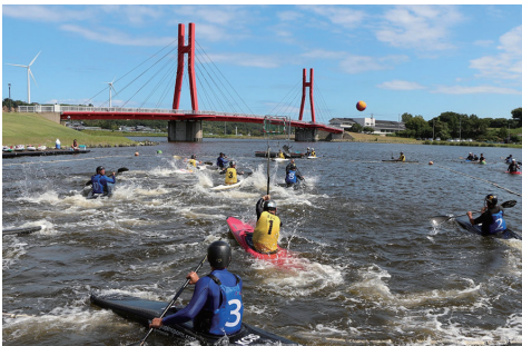
北潟湖(カヌーボロの様子)