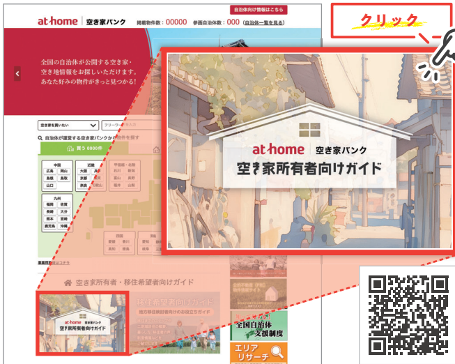
空き家所有者向けガイド

「アットホーム 空き家バンク」トップにある「空き家所有者向けガイド」バナーをクリックすると「空き家所有者向けガイド」サイトが表示されます。