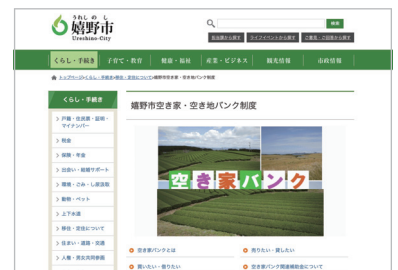
嬉野市 空き家バンク

また、利用者に向けては、本市への定住を目的に、市外からの転入者を対象としたリフォームやDIYなどの改修、不要物の撤去に係る費用への補助制度などを設けています。併せて移住に係る制度の見直しや移住者同士の交流イベントなどを行った結果、福岡県や長崎県などの隣県からの流入や女性人口の増加などもあり、 2024年に消滅可能性都市から脱却 しました。